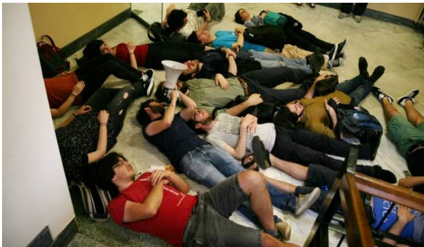
La protesta degli studenti sul numero chiuso nelle facoltà umanistiche